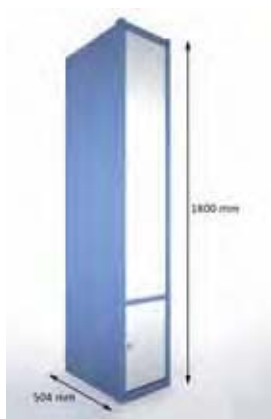
Taquilla banco vestuario