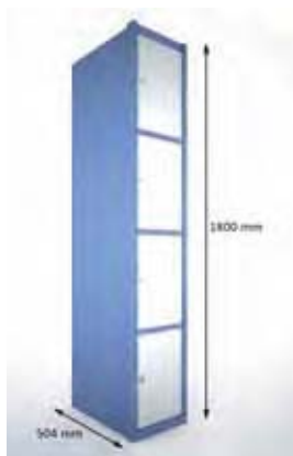
Taquilla 4 puertas